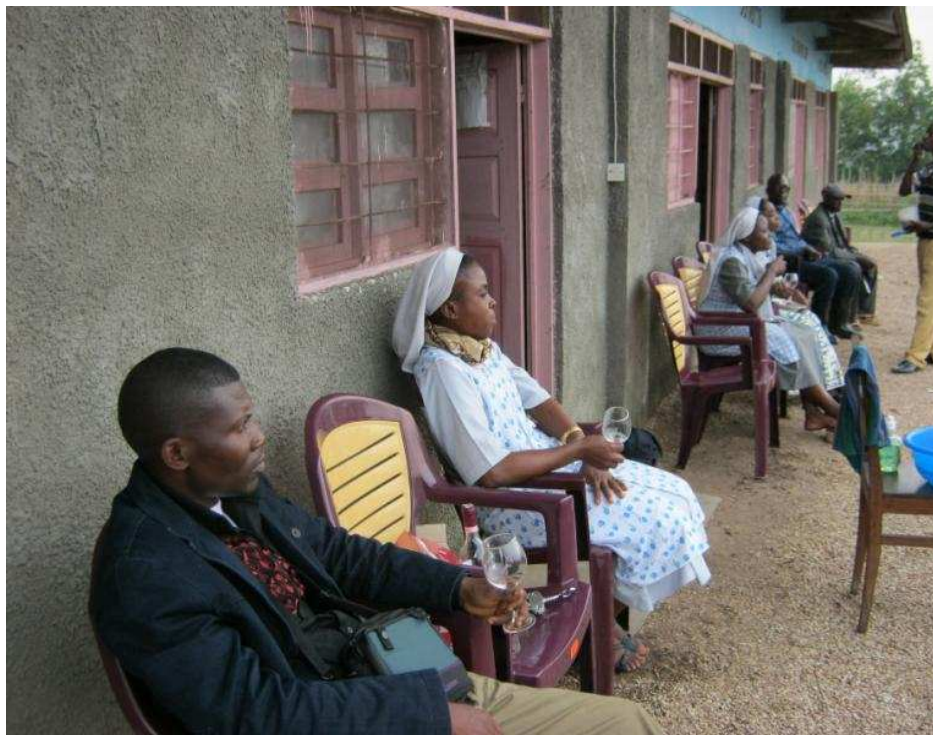
Accueil à la Coordination Catholique Idiopa Sud