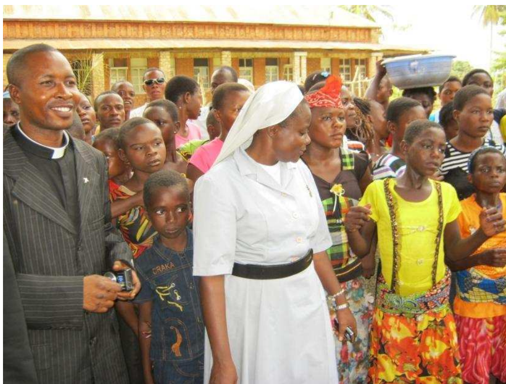
Pas de danse en signe de joie (Curé et Provinciale des sœurs)