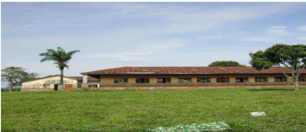
Un des bâtiments du Lycée Ufuta