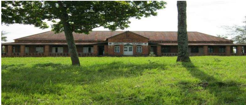
Grand bâtiment de l'Hôpital secondaire de Kilembe