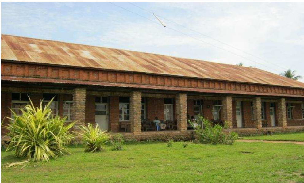
La cure de Kilembe (Vue du devant)