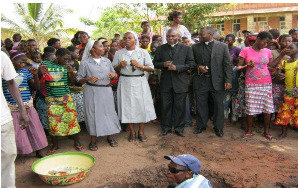
Jouissance avec la population chrétienne