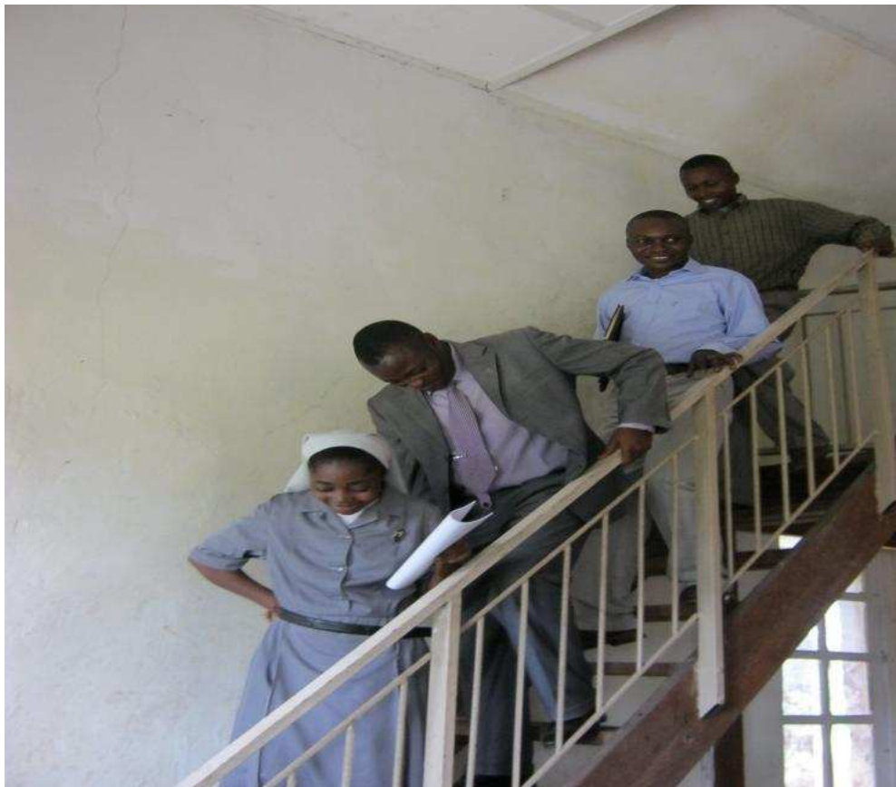
Intérieur du couvent