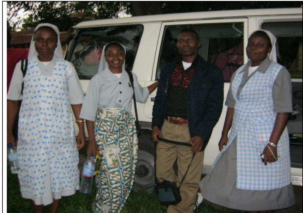
De passage à la M.C. LOZO Munene