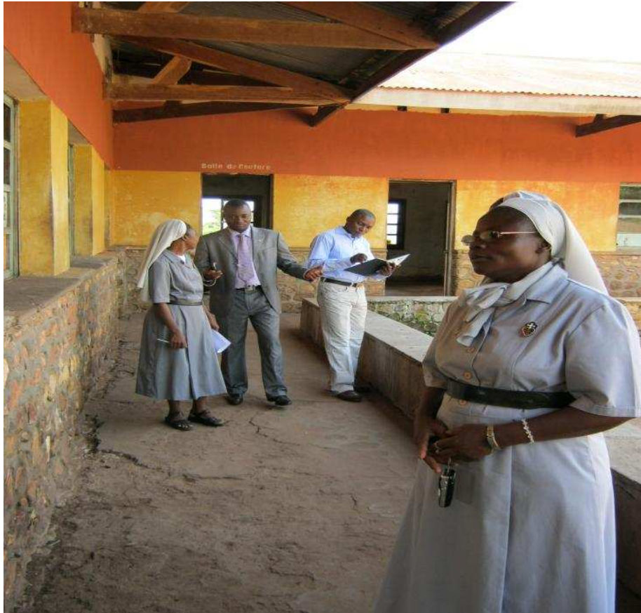
Visite du Lycée Ufuta