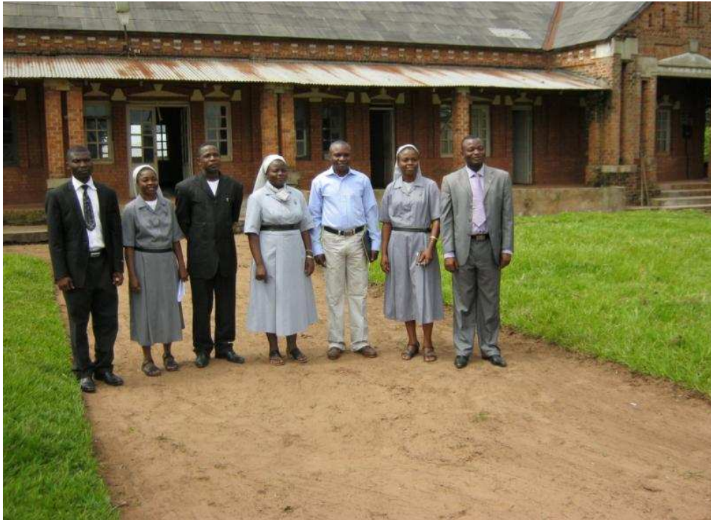
Couvent des Sœurs (Façade du devant)