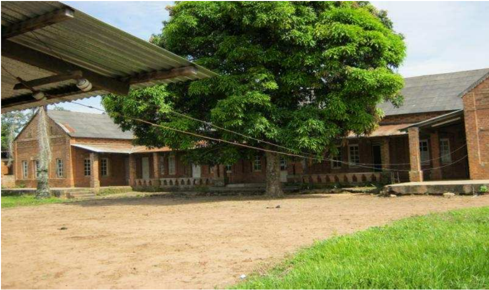
Le couvent des sœurs (Vue du derrière)