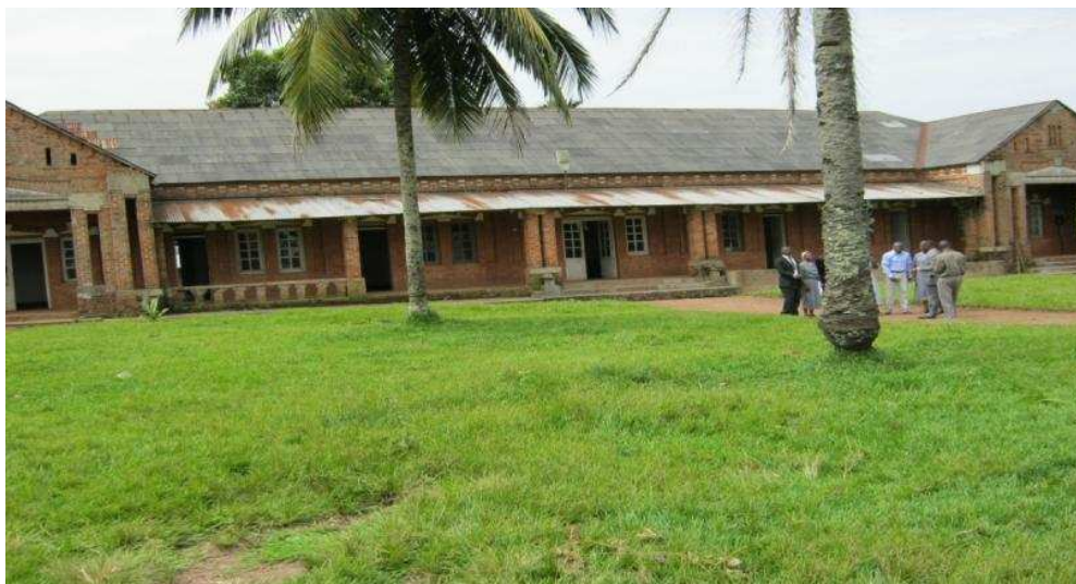
Couvent des sœurs (vue du devant)