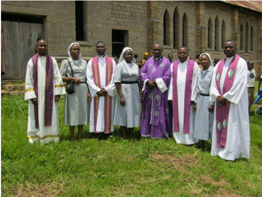
A la sortie de la messe du dimanche