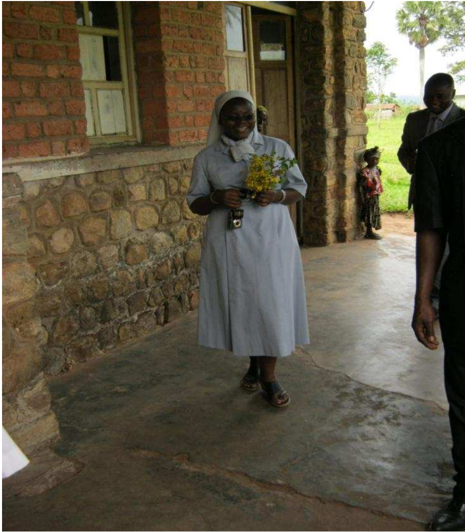
La Supérieure Provinciale devant la maternité